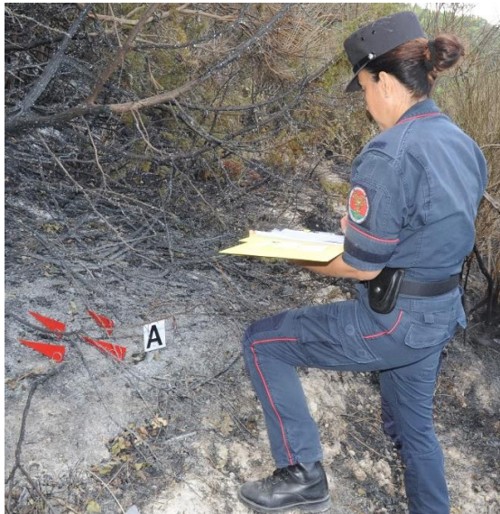
Carabiniere Forestale impegnato nelle fasi di repertazione con il Metodo delle Evidenze Fisiche (MEF), utilizzato per risalire al punto di origine dell'incendio.